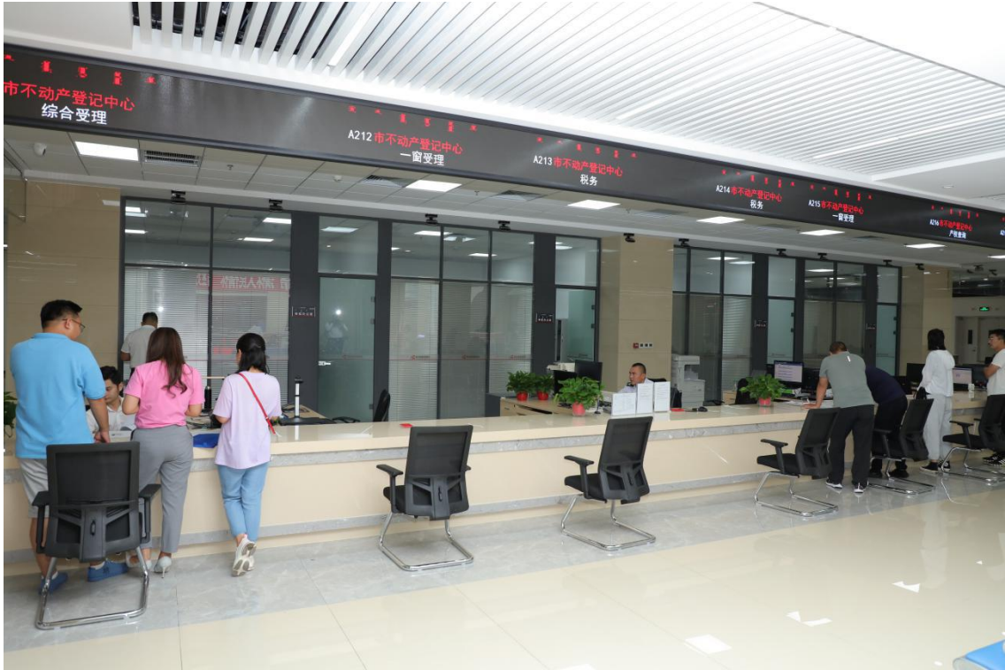
图 3 群众在鄂尔多斯市政务服务新大厅办理业务