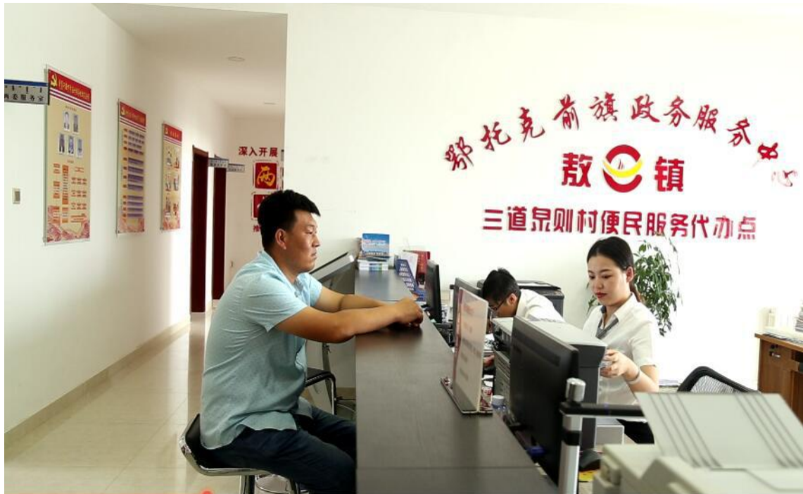
图 5 群众在嘎查村便民服务代办点办理业务