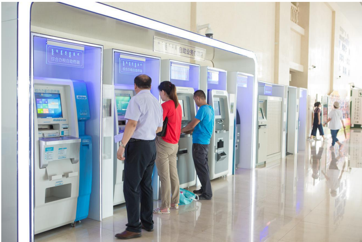
图 4 群众在自助服务区办理业务