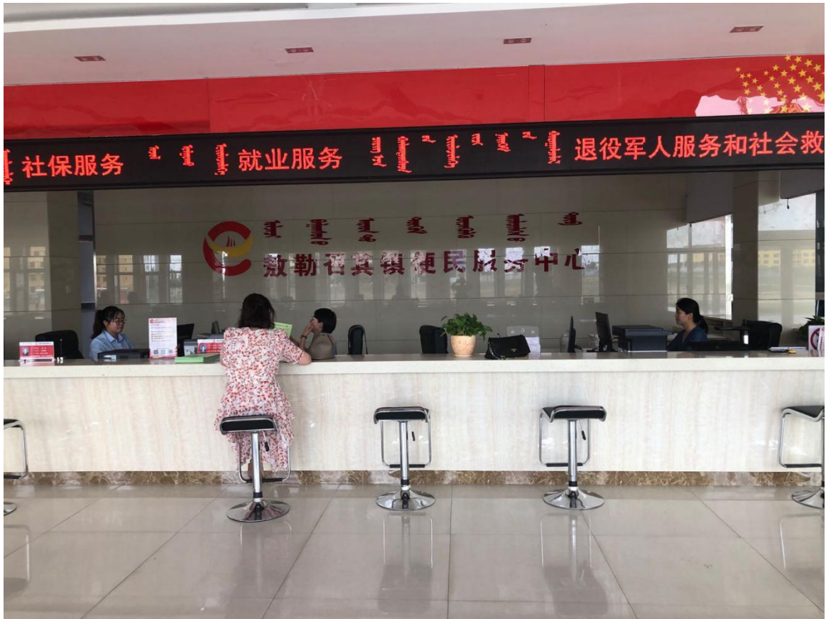
图 4 群众在苏木乡镇便民服务中心办理业务