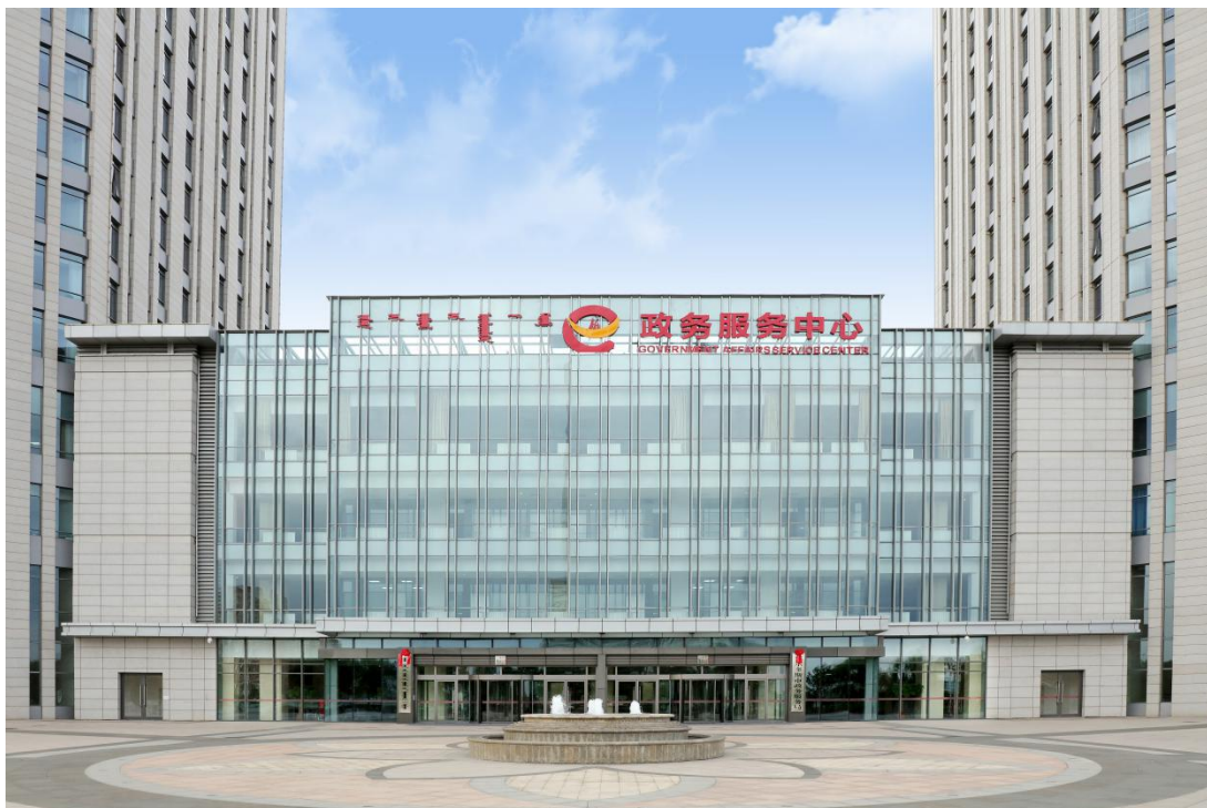
图 2 鄂尔多斯市本级、伊金霍洛旗、康巴什区政务服务中心集中进驻政务服务新大厅