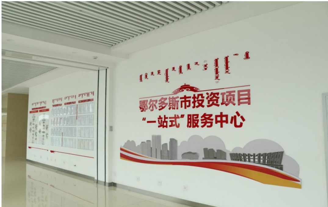
图 6 2019 年 6 月市、旗区成立了投资项目“一站式”服务中心