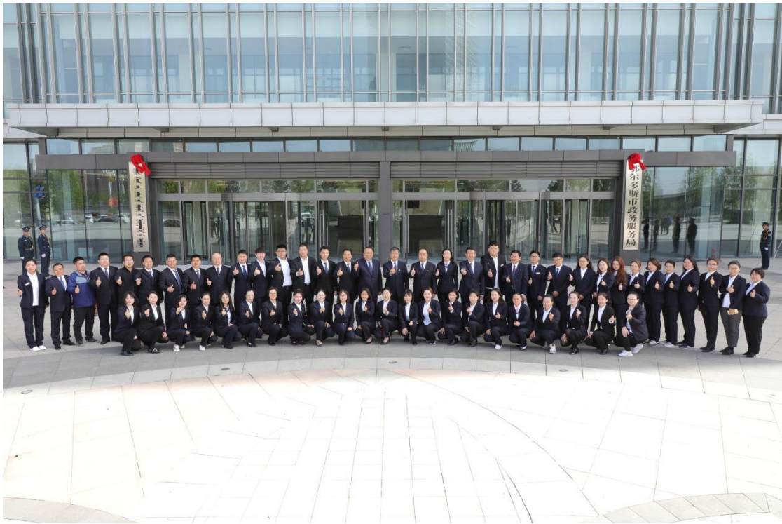
图 1 2019 年 5 月 27 日市政务服务中心搬迁新址